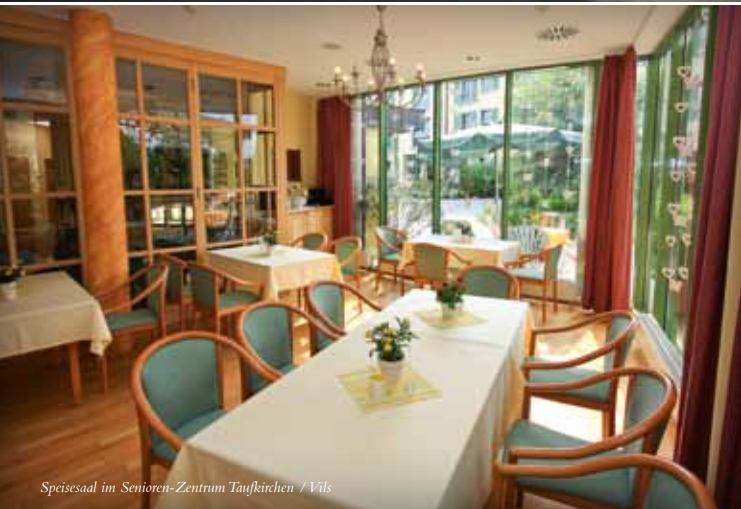
Speisesaal im Senioren-Zentrum Taufkirchen / Vils