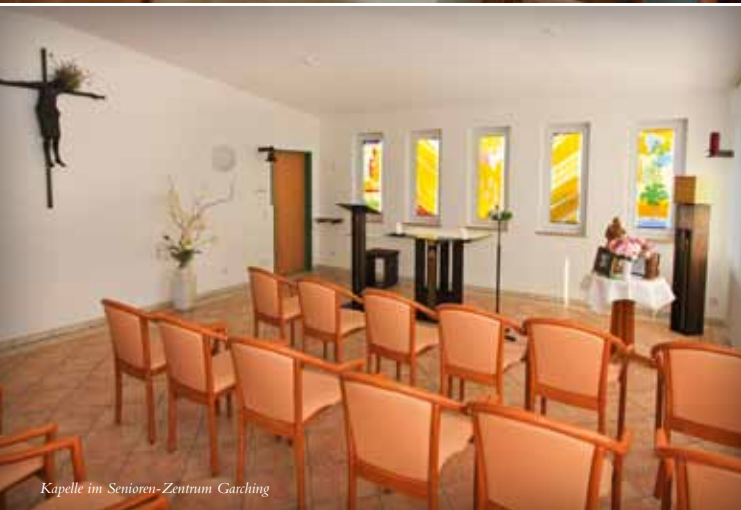
Kapelle im Senioren-Zentrum Garching